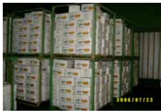
[ 유통공사 창고 적재 광경 ]