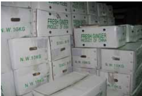
[민간 창고 적재품]