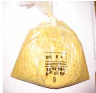
[ 갈아서 포장된 생강 ]