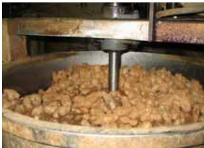
[탈 피 기]