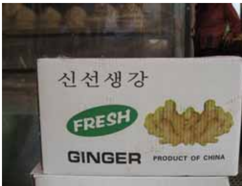
[ 외포장 ]