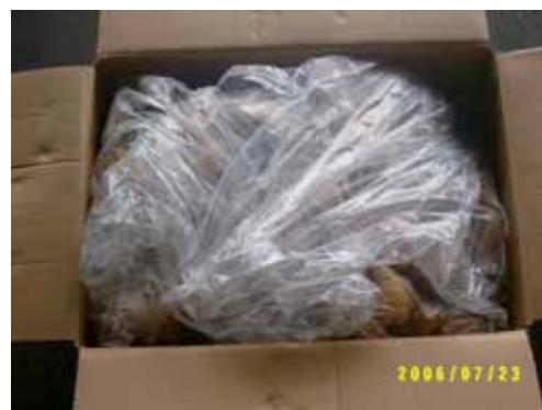
[ 내포장 ]