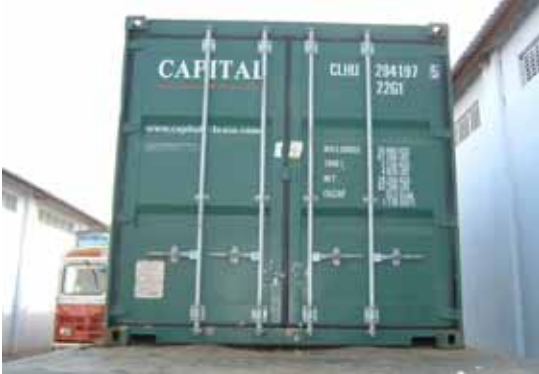
[ 운반 컨테이너 ]