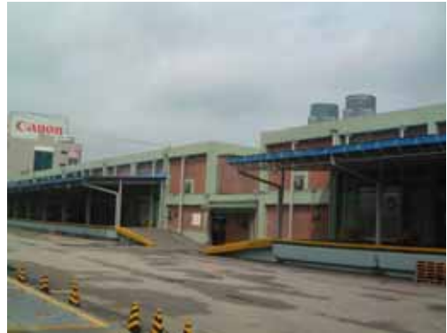
[ 유통공사 비축창고 전경 ]