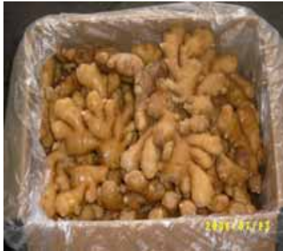
[ 원강 ]