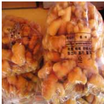
[ 탈피된 원강 ]